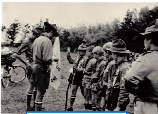
1.patrulje Elsdyr 1968-69