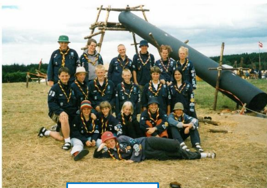
Blå Sommer 1999